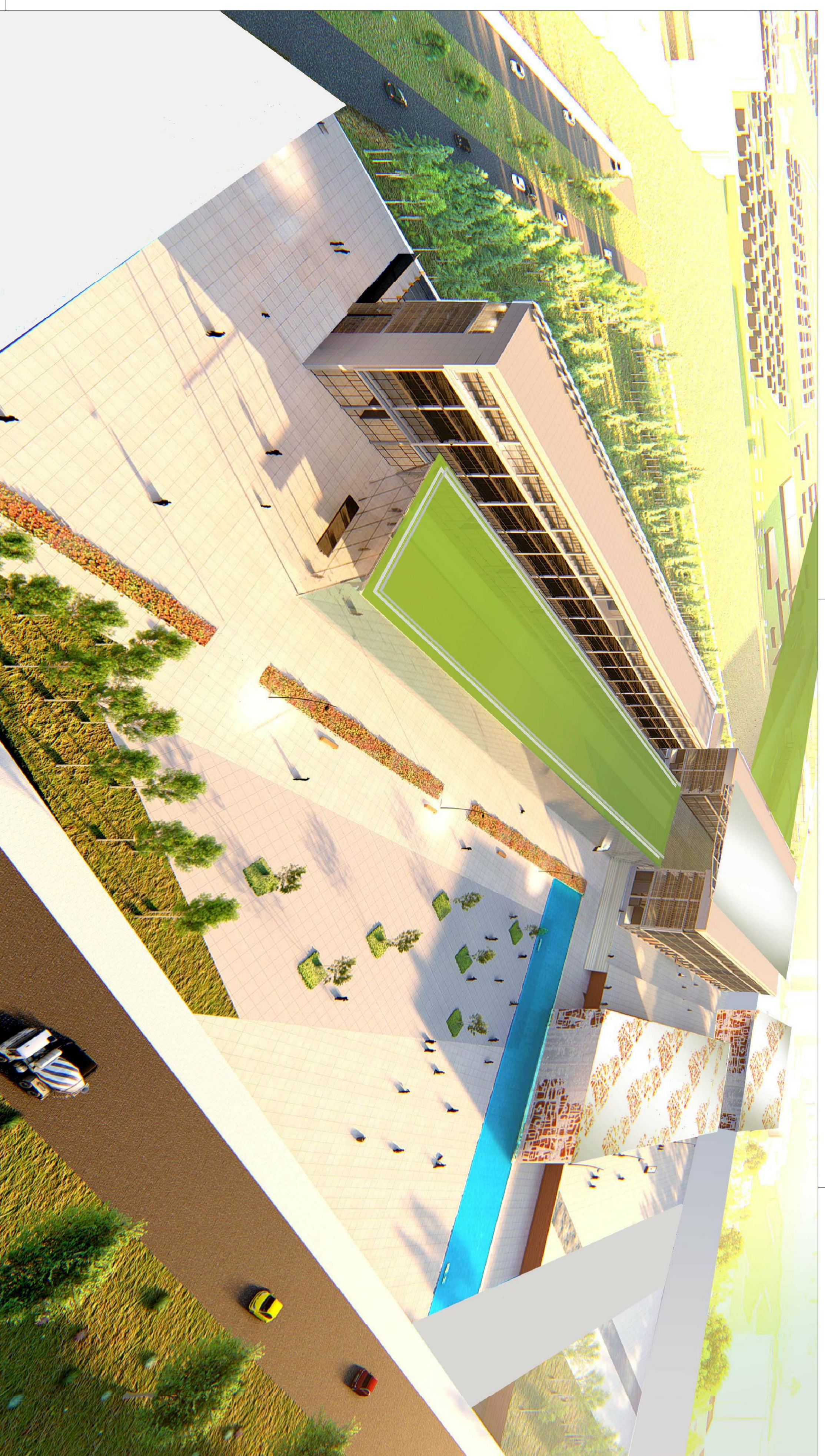
1 PERSPECTIVA DO COWINGO ARQUITETÔNICO SUA ESCALA