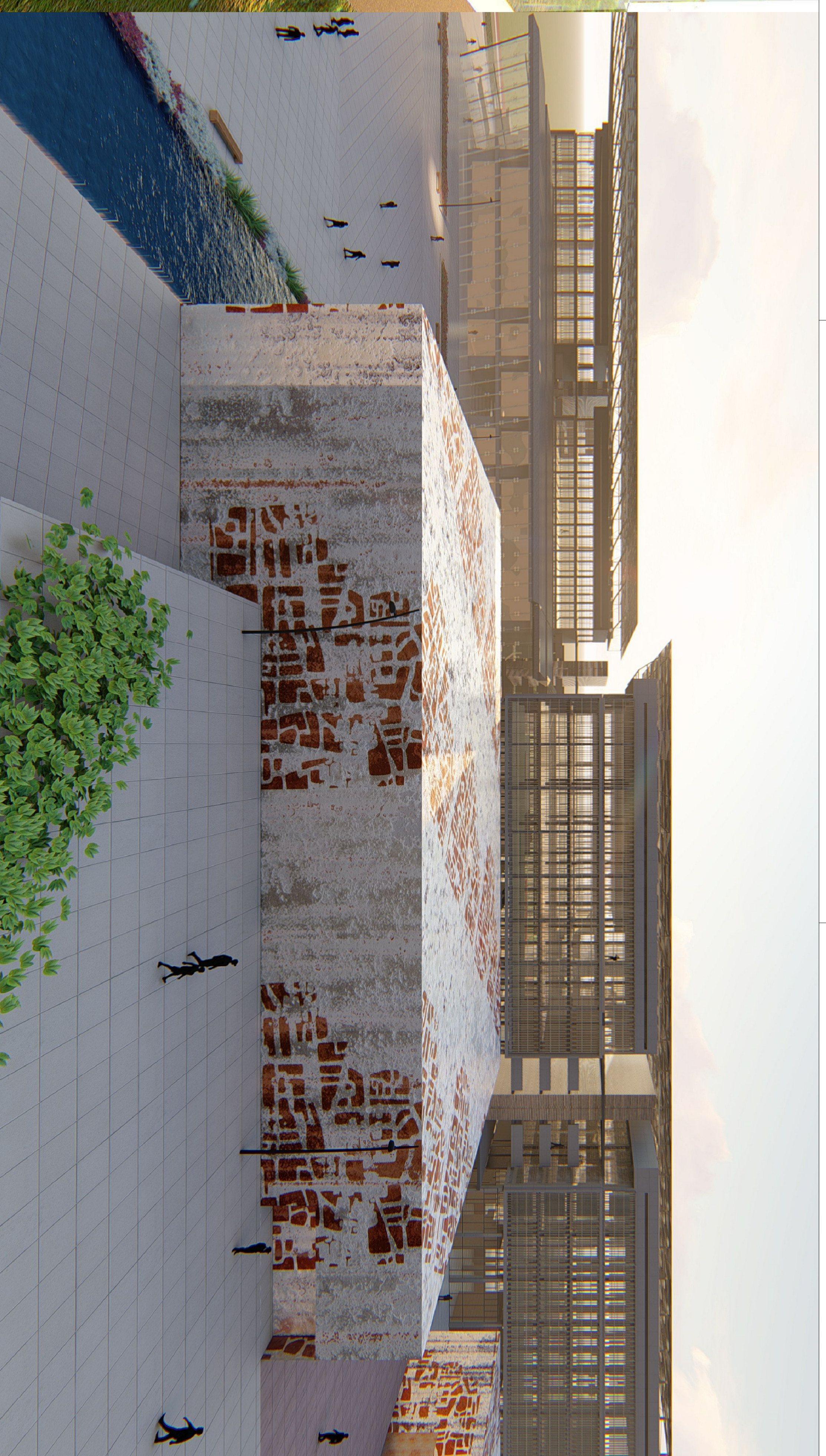
2 PERSPECTIVA DO COWINGO ARQUITETÔNICO SUA ESCALA